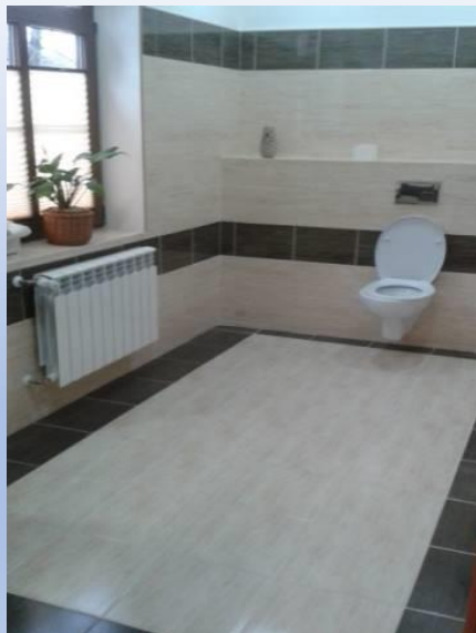
Zdjęcie toalety GOUK w Kalnicy