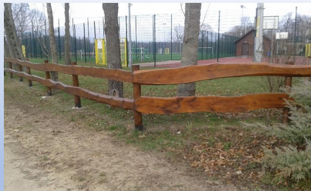
Zdjęcie - wymienione ogrodzenie wokół terenu GOUK w Kalnicy