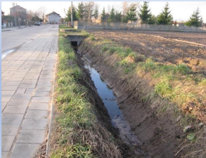
Zdjęcie - Oczyszczony rów i chodnik przy drodze gminnej m. Brańsk- Kiersnówek