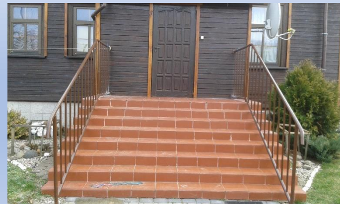
Zdjęcia – budynek GOUK w Kalnicy