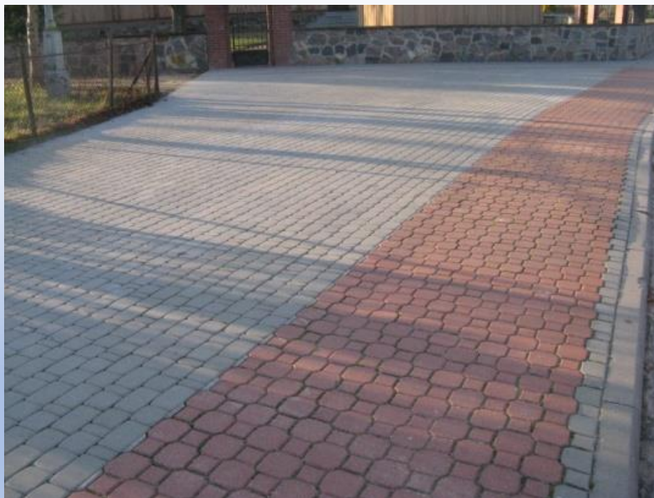
Zdjęcie - remont chodnika przy kościele w Domanowie