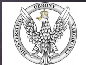
Ministra Obrony Narodowej